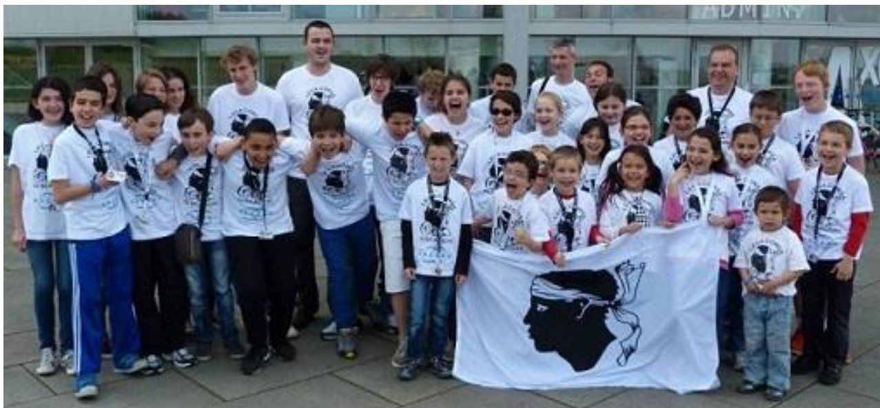
La délégation corse aux championnats de France!

Cadre : Championnat de France des jeunes. Déplacement de la délégation Corse dont le « pôle d'excellence ».