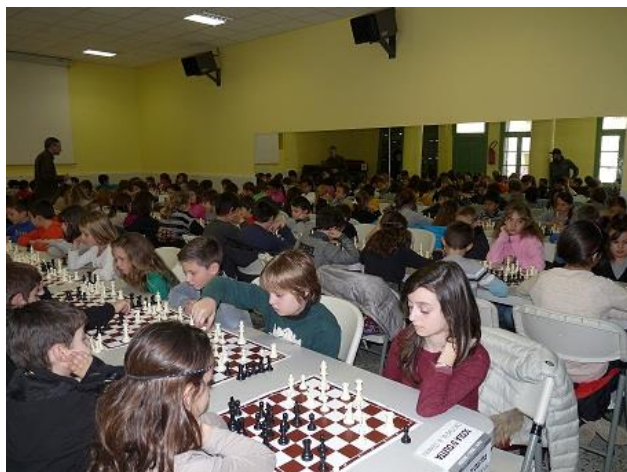
Qualificatifs dans le Nebbiu...

Lieu : Université de Corse- 15 et 16 mars 2014.