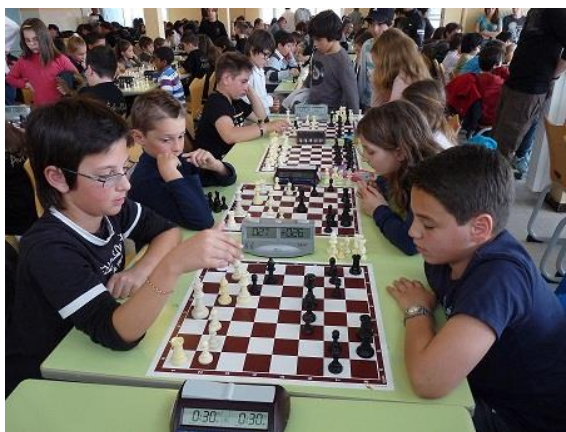
Match par équipe à Corte.

Lieu : Lycée Pascal Paoli de Corti R4, 5 et 6