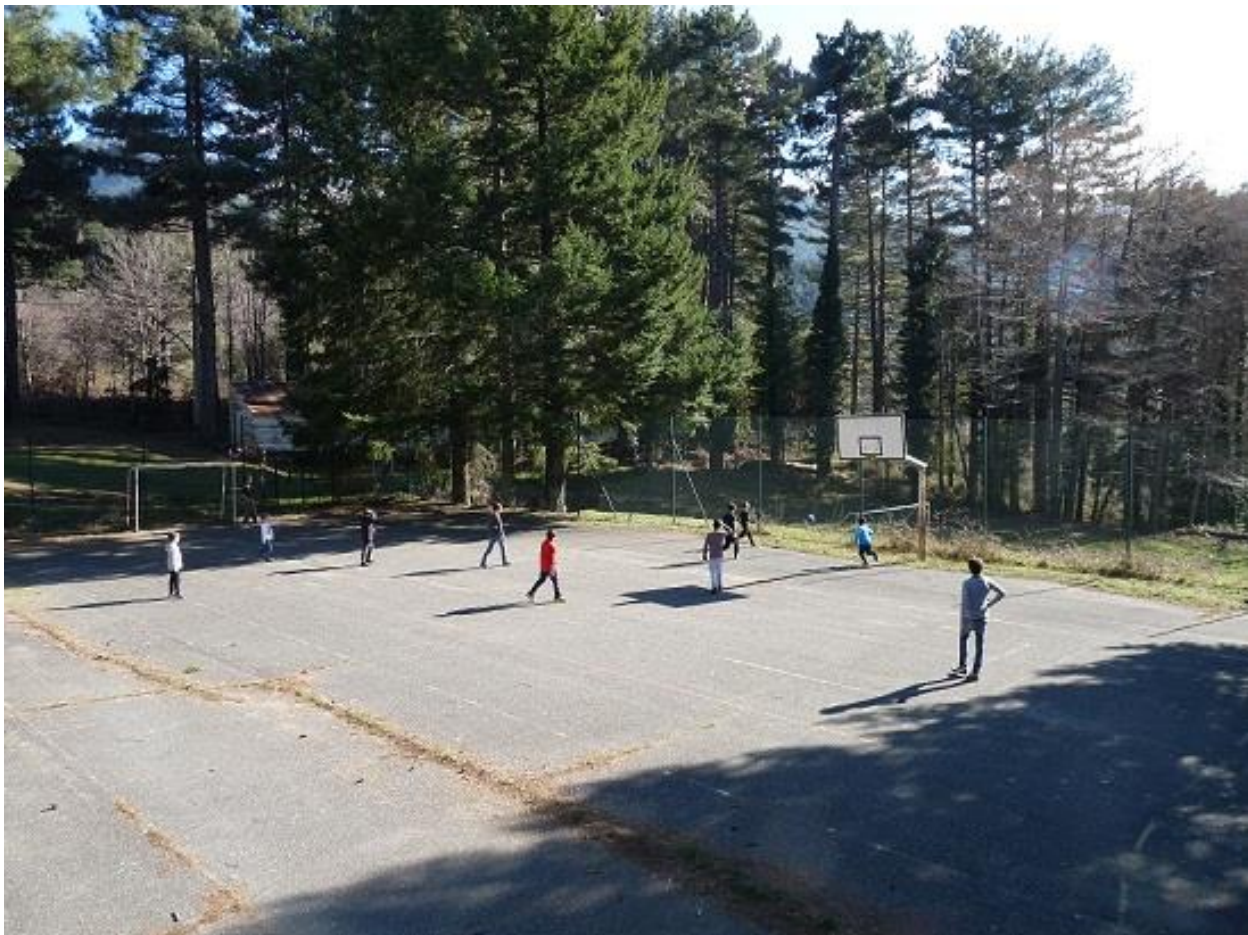
Du sport !