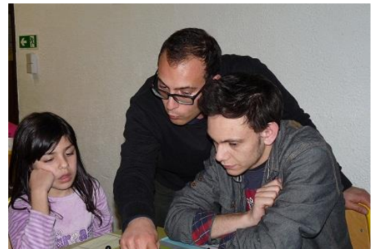
Conseils avisés des 2 Maîtres Internationaux!

Il faut leur donner un système rapide pour jouer contre ces ouvertures dangereuses. L'approche doit être très concrète. Ne pas se lancer dans les méandres de la théorie : juste les idées de l'ouverture, un système rapide et du jeu sur le système donné.