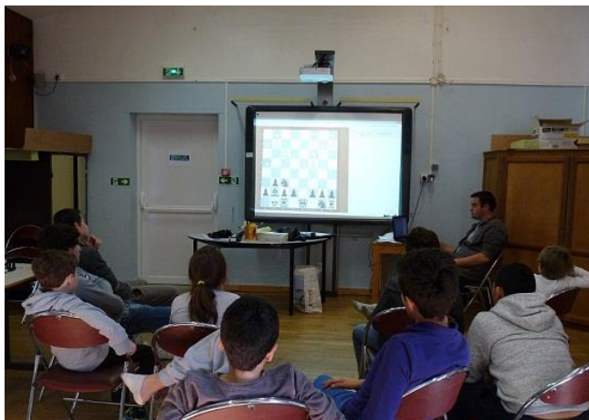
Cours de groupe

Les entraînements théoriques se décomposent en un entraînement en groupe de 2h par semaine (notions de stratégie, tactiques...) et d'un entraînement en tête à tête: entre 2h et 4h par semaine (travail en profondeur, constitution d'un répertoire d'ouverture, acquisition des techniques en finale ...) pour chacun des enfants sélectionnés dans le « Pôle d'excellence ».