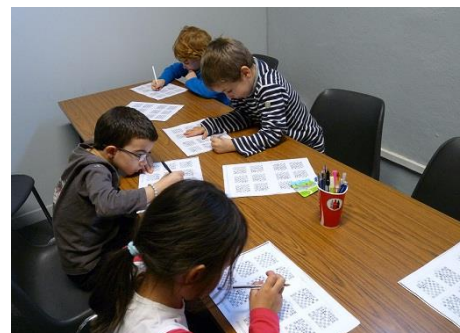
Séance tactique lors d'un stage à Bastia.

Ce sont des stages mensuels. Ils ont lieu sur un week-end dans les maisons des échecs (casa di i scacchi) : à Corte, à Ajaccio et à Bastia.