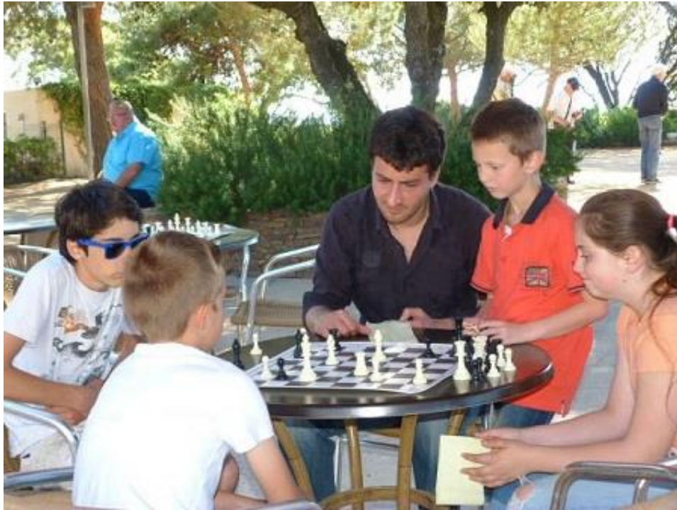
Analyses de parties...