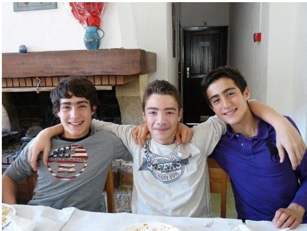
Des jeunes ravis !