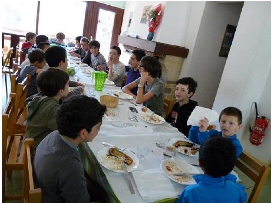
La vie en groupe....