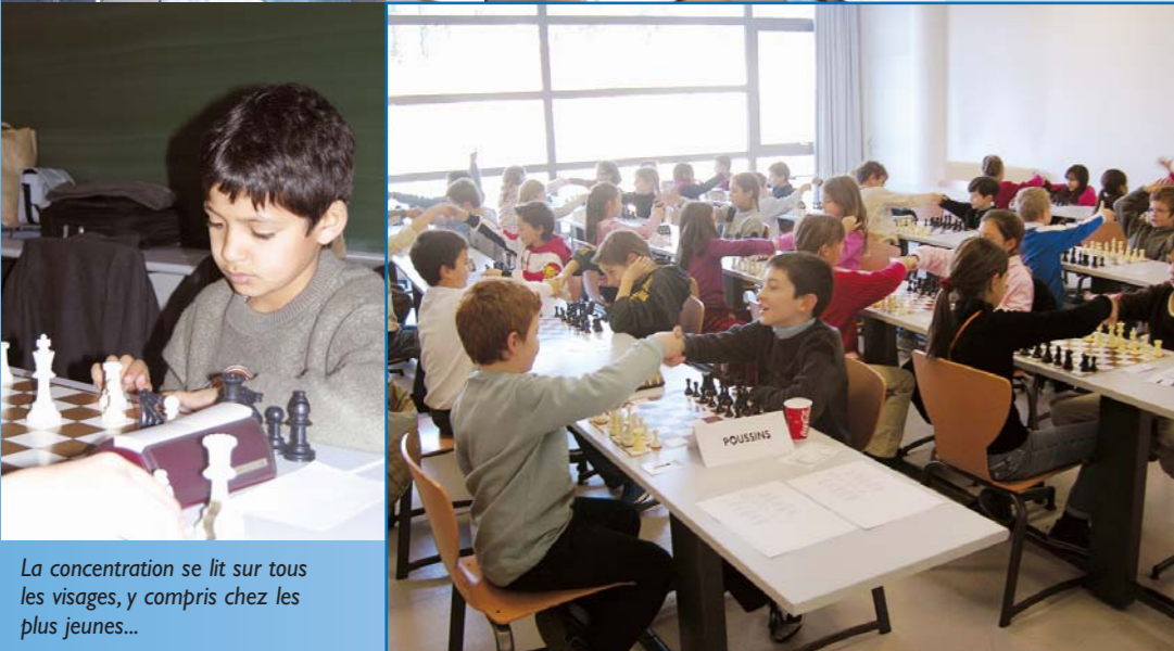
La concentration se lit sur tous les visages, y compris chez les plus jeunes...