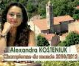
Alexandra KOSTENIUK Championne du monde 2008/2013